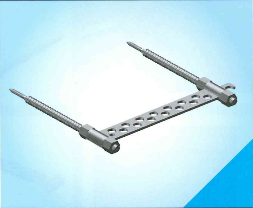
1 Einsatz des WDVS-Ankers mit Blitz Anker.